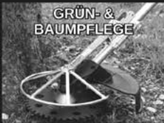
GRÜN- & BAUMPFLÉGE