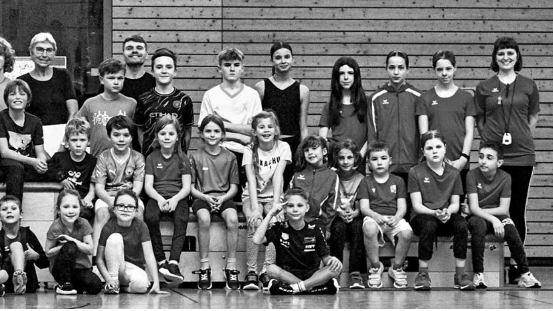
Mannschaften SV Waizendorf