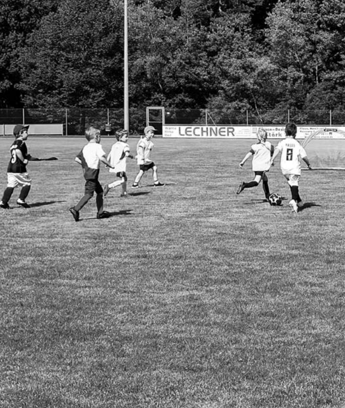
Erste Funino Versuche in Walsdorf