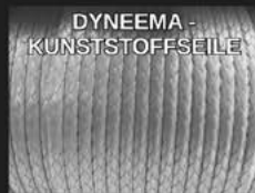
DYNEEMA - KUNSTSTOFFSEILE