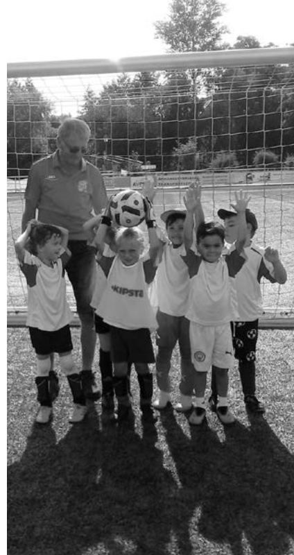
1. Spiel 5 gegen 5 in Baunach