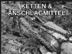
KETTEN & ANSCHLAGMITTEL