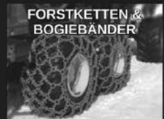
FORSTKETTEN & BOGIEBÄNDER