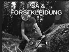
PSA & FORSTKLEIDUNG